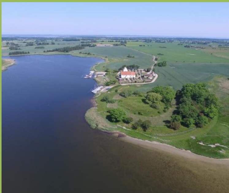
Noret, Slotsbanken og kirken set fra syd mod Nord.