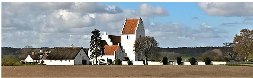
Graverbolig, Rejsestalden og Jungshoved Kirke set fra øst.